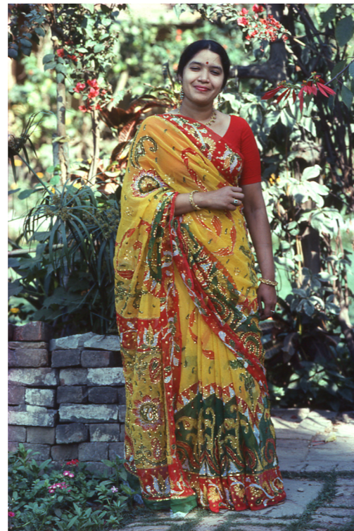
Sari van dunne machinaal geweven stof, versierd met fijn tamboereerwerk en lovertjes, India

Deze sari is van dunne doorschijnende katoen. Ze is versierd met gouddraad en gouden lovertjes: een deel van de lovertjes is bewerkt en een deel is glad. Alle versiering is met de hand aangebracht, van de stempels met rode en groene kleur tot de verfijnde geborduurde randen. Het deel van deze sari dat rond het middel van de draagster zit, is niet versierd waardoor de sari lekkerder draagt.