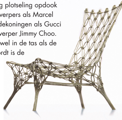
Knotted Chair van Marcel Wanders (1996) gemaakt van aramide koolstofvezels, Nederland

Macramé is een techniek waarbij draden geknoopt worden. De vroegst bekende toepassing komt uit het Babylonische Rijk, zo'n 1500 jaar voor Christus. In de jaren zeventig van de vorige eeuw was macramé korte tijd zeer populair: vrouwen maakten er kleding, spreien, tassen en wandkleden van. Macramé kreeg daarna een diep truttig imago, tot de techniek rond de eeuwwisseling plotseling opdook bij moderne ontwerpers als Marcel Wanders en modekoningen als Gucci en schoenenontwerper Jimmy Choo. De knoop die zowel in de tas als de stoel gebruikt wordt is de weitasknoop.