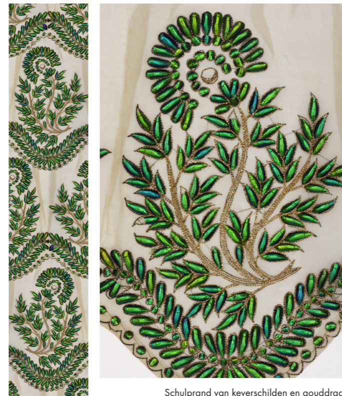
Schulprand van keverschilden en gouddraad (1855), Hyderabad, India

Doe je ogen dicht, ga in gedachten naar India en bedenk hoeveel werk gedaan moet worden om te kunnen borduren met schilden van insecten. De beestjes moeten eerst gevangen worden, dan gedood, vervolgens moeten hun aantrekkelijke schilden heel voorzichtig losgewrikt worden om er daarna gelijkvormige stukjes van te maken en die van minuscule gaatjes voorzien. Dan pas kan het borduren met duizenden keverpailletten en gouddraad beginnen. Het is helaas niet bekend hoeveel kevers het leven laten voor één meter borduurwerk. Deze versiering was zeer geliefd in de 19 de eeuw, dezelfde tijd dat rijke vrouwen veren — en soms zelfs hele vogels — op hun hoeden staken om te pronken met de vormen en kleuren uit de natuur. Deze weelderig geborduurde rand komt uit het V&A museum in Londen, dat één van de rijkste en belangrijkste textielcollecties in de wereld bezit. Omdat de groenblauwe keverpailletten zo kwetsbaar zijn werden ze vooral toegepast op sjaals, langs de rand van een sari of voor westerse vrouwen op hoeden en baljurken. Stel je voor hoe de kevervleugels schitteren in een balzaal die met kaarsen is verlicht. Omdat het borduursel zo kwetsbaar is, is er weinig keverversiering bewaard gebleven.