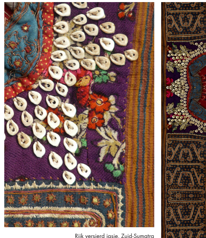
Rijk versierd jasje, Zuid-Sumatra

Een broodje kopen met schelpen: in onze digitale tijd is dat haast niet meer voor te stellen. Toch dienden de kaurischelpjes op dit prachtige jasje vroeger niet alleen als decoratie, maar ook als betaalmiddel. De zeemannen van de VOC ruilden tijdens hun reizen scheepsladingen vol schelpen voor kruiden en specerijen. En daar bleef het niet bij, de kauri's werden zelfs geruild voor slaven: voor een Afrikaanse slaaf betaalden de VOC-ers 50.000 tot 100.000 schelpen. Dit jasje is afkomstig uit Zuid-Sumatra en rijkelijk versierd. Er is gewerkt met verschillende applicaties en zogenaamd 'spiegeltjesborduren': een techniek waarbij spiegeltjes worden vastgeborduurd in uitsparingen in de stof. Daardoor schittert het jasje in de zon. Rond de kraag is een sterpatroon van schelpjes gemaakt. Naast een betaalmiddel en een mooie versiering is de kaurischelp in veel culturen ook een vruchtbaarheidsymbool en een geluksbrenger. Door kaurischelpen te dragen gaf je jezelf dus zowel een rijke uitstraling als bescherming tegen kwade machten. Met een beetje geluk was ook de vruchtbaarheidsgodin de drager goed gezind. De decoratie van het jasje bestaat uit verschillende losse delen stof, die zorgvuldig aan elkaar zijn gezet.