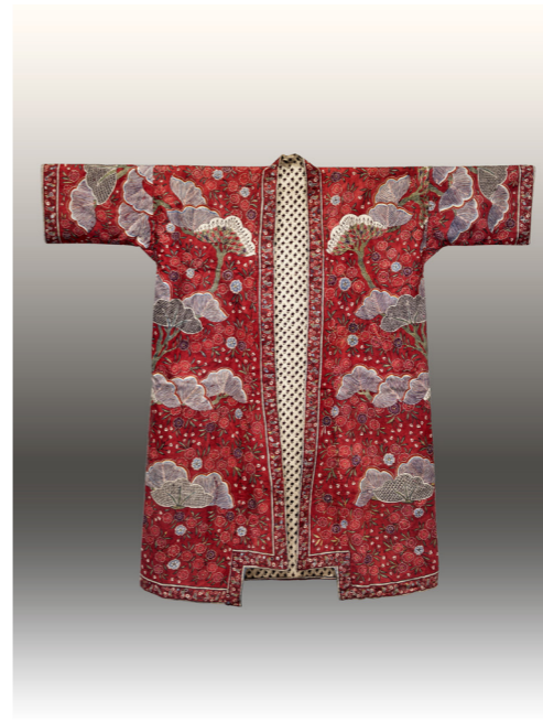
Japanse rok in 'Japanse stijl' voor de Nederlandse markt, gevoerd met Indiaas bedrukt katoen. Katoen, geverfd in sitstechniek, 1700-1750, India

Hoewel deze kimono je onmiddellijk laat dagdromen over Japanse bloesemtuinten, word je stiekem een beetje misleid. Het motief is weliswaar Japans, maar de stof is rond 1700 in India geverfd. Met behulp van verschillende verfbaden zijn prachtige kleurnuances aangebracht. Het geel is zelfs met de hand ingeschilderd. Een arbeidsintensieve klus.