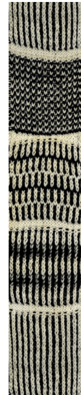
Gebreide proeflap van vier meter lang en vijf centimeter breed (1896), Nederland

Deze lange smalle katoenen slinger – gebreed op superdunne naalden nummer één – is gemaakt door een leerling van de Industrieschool voor Vrouwelijke Jeugd in Amsterdam. Met zo'n werk – dat vier meter lang is en vijf centimeter breed – was iemand weken bezig. De lap was bedoeld voor studie: er zijn minimaal 75 soorten verschillende breisteken in verwerkt: van ajour tot kabels.